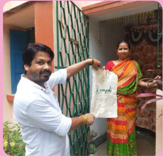
क्षेत्रीय संस्थान-1, असनसोल