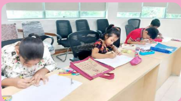
क्षेत्रीय संस्थान-4, नागपुर