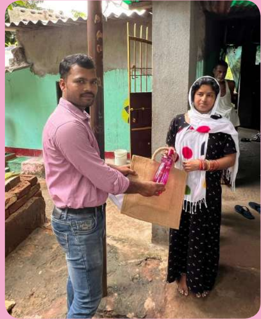
क्षेत्रीय संस्थान-7, भुवनेश्वर