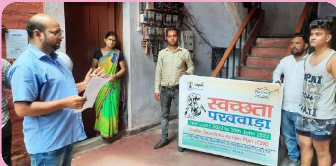
क्षेत्रीय संस्थान-2, धनबाद