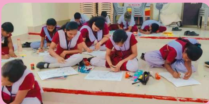
क्षेत्रीय संस्थान-6, सिंगरौली