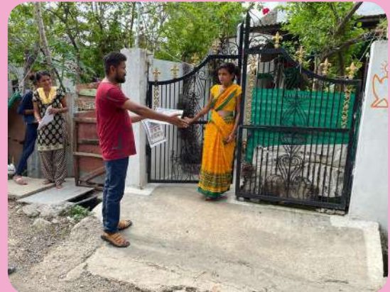
क्षेत्रीय संस्थान-4, नागपुर