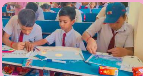
क्षेत्रीय संस्थान-7, भुवनेश्वर