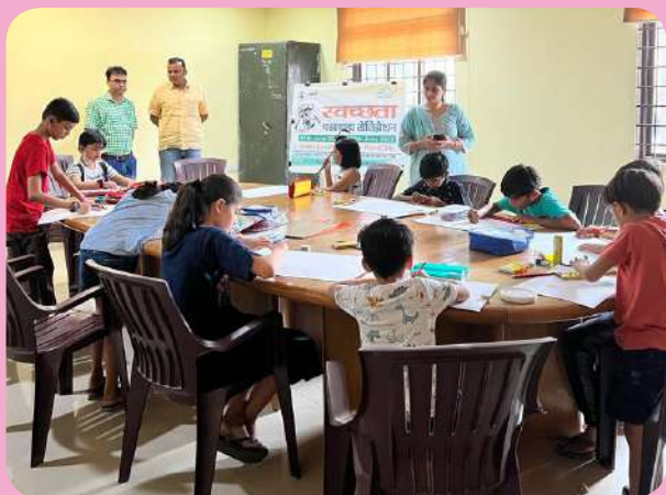
क्षेत्रीय संस्थान-5, बिलासपुर