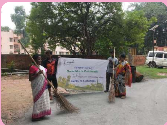
क्षेत्रीय संस्थान-1, आसनसोल