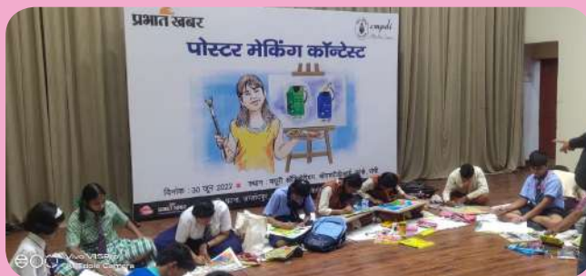
क्षेत्रीय संस्थान-3, रांची