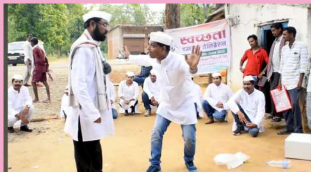
क्षेत्रीय संस्थान-5, बिलासपुर