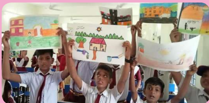
क्षेत्रीय संस्थान-7, भुवनेश्वर