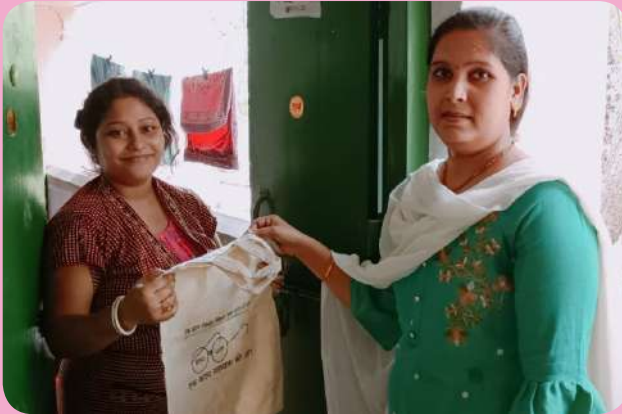
क्षेत्रीय संस्थान-1, आसनसोल