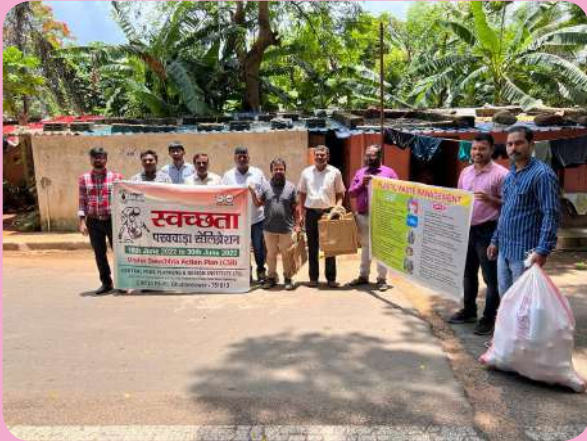
क्षेत्रीय संस्थान-7, भुवनेश्वर