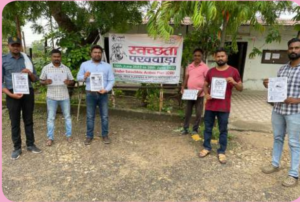
क्षेत्रीय संस्थान-4, नागपुर