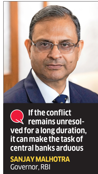
If the conflict remains unresolved for a long duration, it can make the task of central banks arduous SANJAY MALHOTRA Governor, RBI

The attack on Iran started on February 28 following which the West Asian nation stopped the Strait of